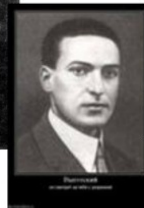
Выготский Лев Семёнович