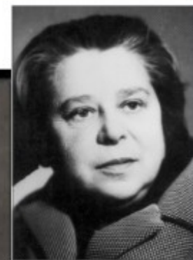
Божович Лидия Ильинична