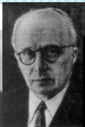
Рубинштейн Сергей Леонидович